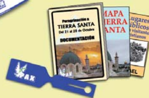
Información completa, etiquetas...