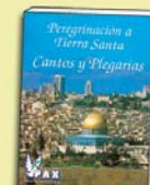
Libro de Cantos y Plegarias