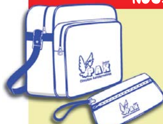
Bolsa y cartera documentación