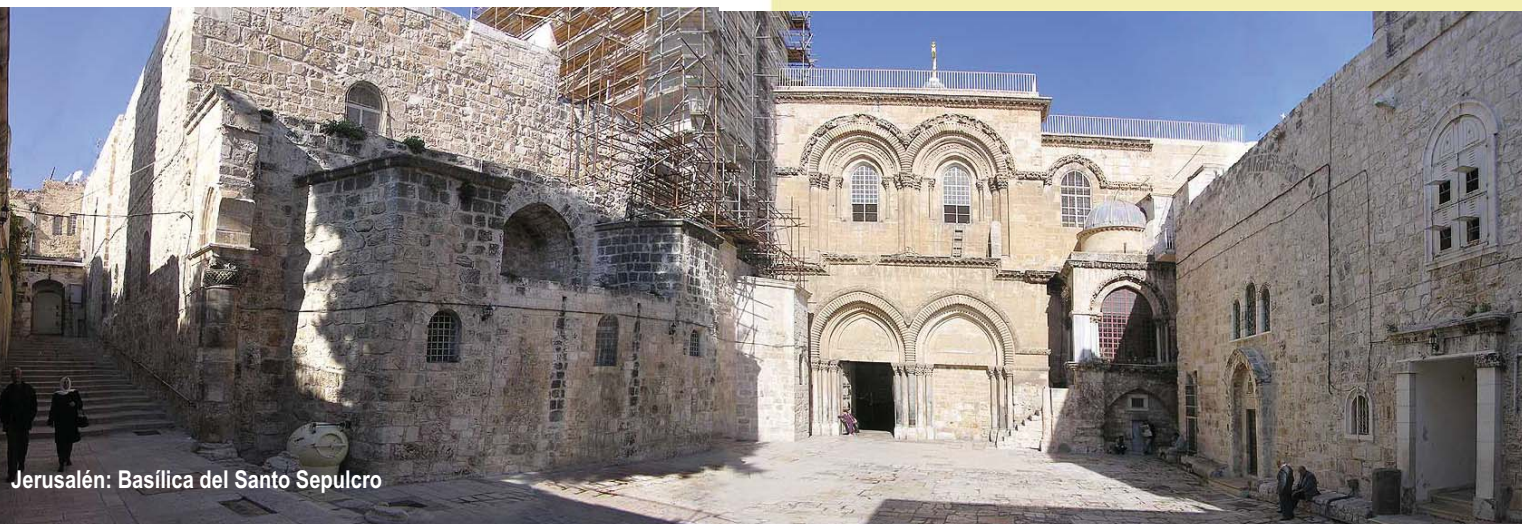
Jerusalén: Basílica del Santo Sepulcro